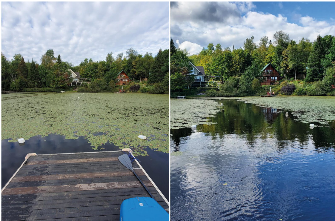
Le lac Héroux à Saint-Boniface, avec et sans Brasénie de Scherber.

Des membres de l'Association des riverains du Lac Héroux et des Six (ARLHLS) se sont rassemblés au cours des dernières semaines pour retirer une plante aquatique autour du Lac Héroux, à Saint-Boniface. Cette plante a limité plusieurs usages du lac, ce qui a défavorisé les propriétaires riverains qui se servent du lac sur une base régulière. Lire l'article>>