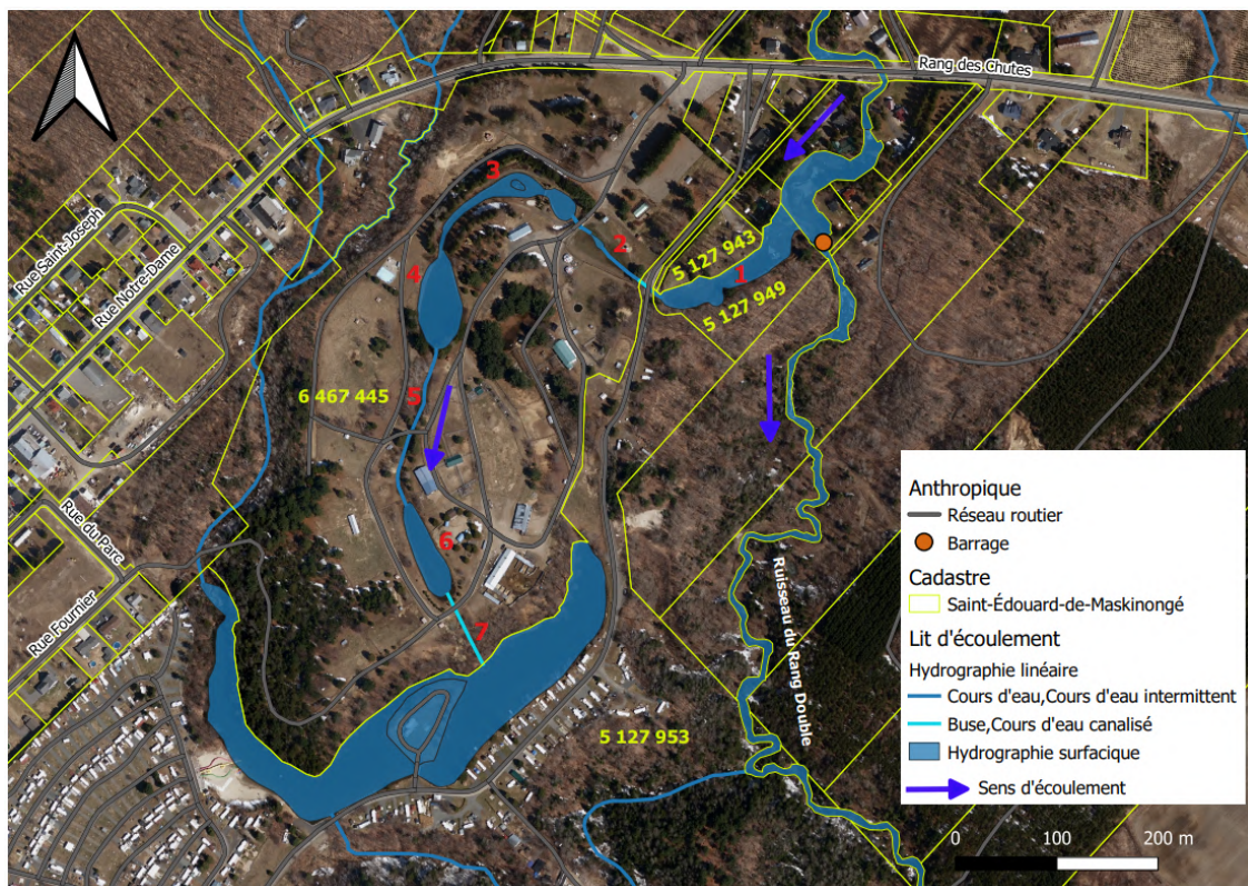
Carte de localisation.

Le conseil a pris acte du rapport du gestionnaire régional des cours d'eau en lien avec la demande de détermination du statut d'un lit d'écoulement présent sur le lot 6 467 445 à Saint-Édouard-de-Maskinongé.