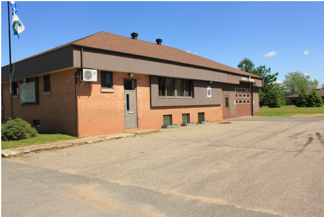
Mairie de Charette

Le ministère des Affaires municipales et de l'Habitation (MAMH) a dévoilé son nouveau Programme d'amélioration et de construction d'infrastructures municipales (PRACIM), le 13 avril 2022. Des bonifications importantes de l'aide financière ont été annoncées pour contribuer à l'amélioration, à l'ajout, au remplacement et au maintien des bâtiments municipaux, qu'ils soient à vocation municipale ou communautaire incluant les casernes pour les services de sécurité incendie municipaux. De plus, les nouvelles modalités du PRACIM font en sorte que près de 360 municipalités sont maintenant admissibles à l'aide financière.