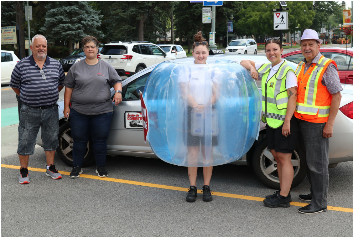
Activité de sensibilisation aux différentes traverses piétonnières du centre-ville de Louiseville en compagnie des cadettes de la Sûreté du Québec et de l'école de conduite de Louiseville.

Chaque jour au Québec, des piétons sont heurtés par un véhicule, principalement en zone urbaine.