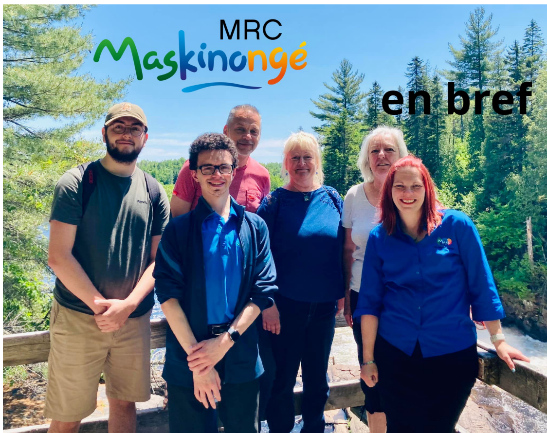
L'équipe du Bureau d'information touristique de la MRC de Maskinongé pour la saison estivale 2022.