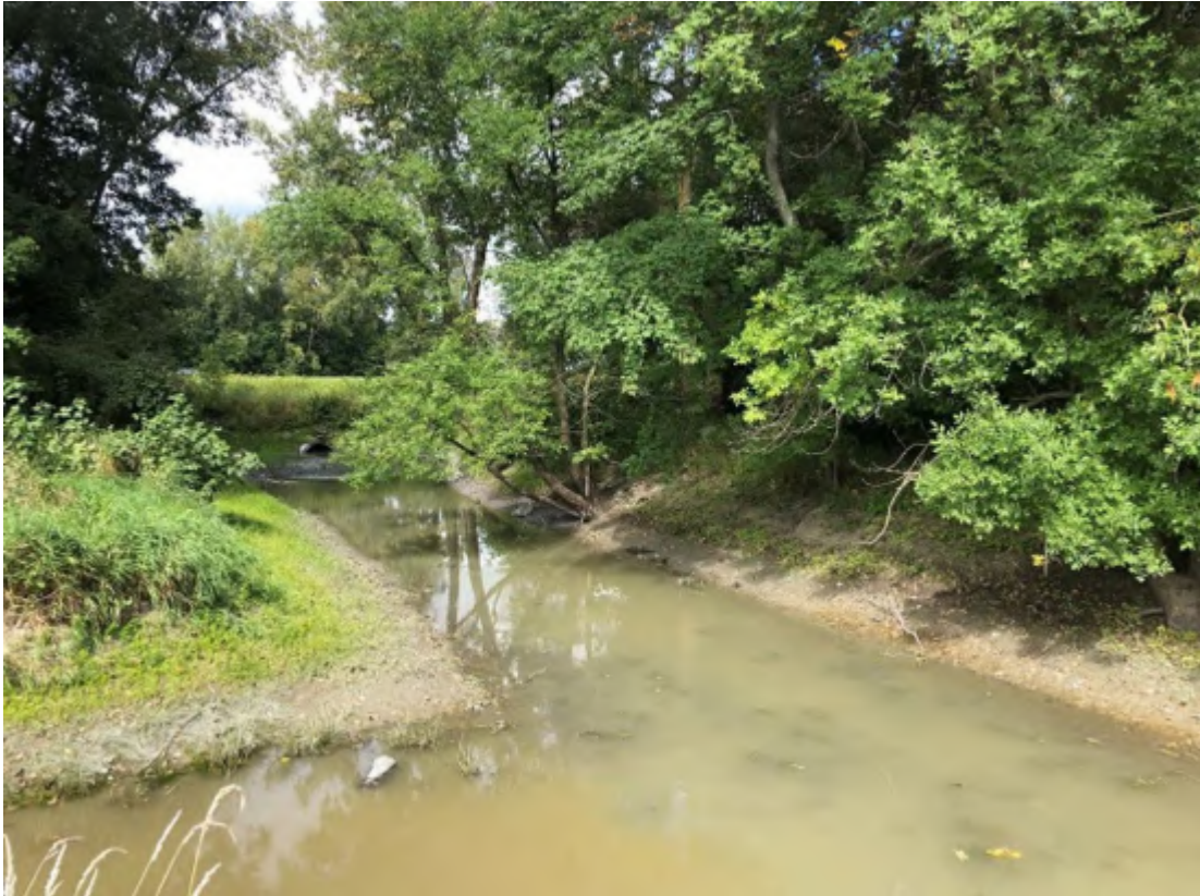
Aspect de la rivière du Bois-Blanc en aval de l'autoroute 40.

Le conseil a refusé la demande pour la réalisation de travaux d'entretien du cours d'eau Rivière du Bois-Blanc à Maskinongé.