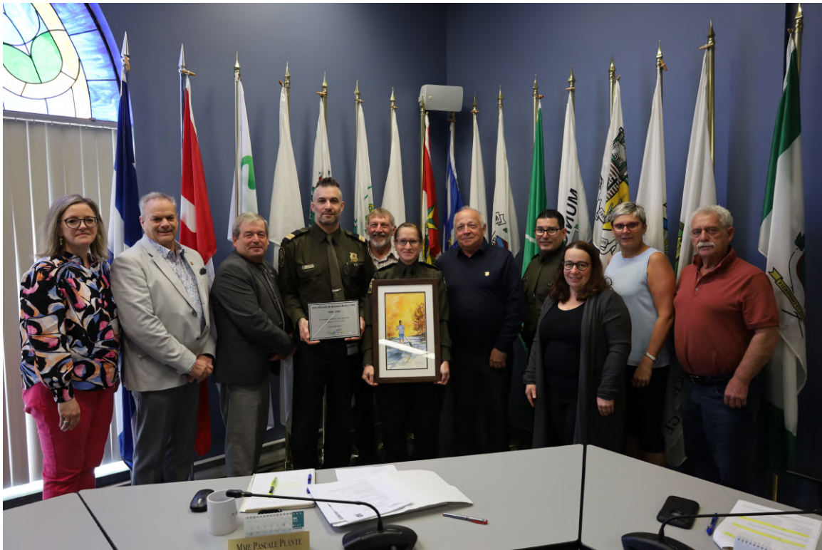
Les membres du Comité de sécurité publique de la MRC de Maskinongé.

Afin de rendre hommage à la sergente Maureen Breau, décédée dans l'exercice de ses fonctions, au cours d'une intervention policière survenue le 27 mars dernier, à Louiseville, la MRC de Maskinongé a tenu à offrir une toile aux représentants de la Sûreté du Québec lors de la dernière rencontre du Comité de sécurité publique.