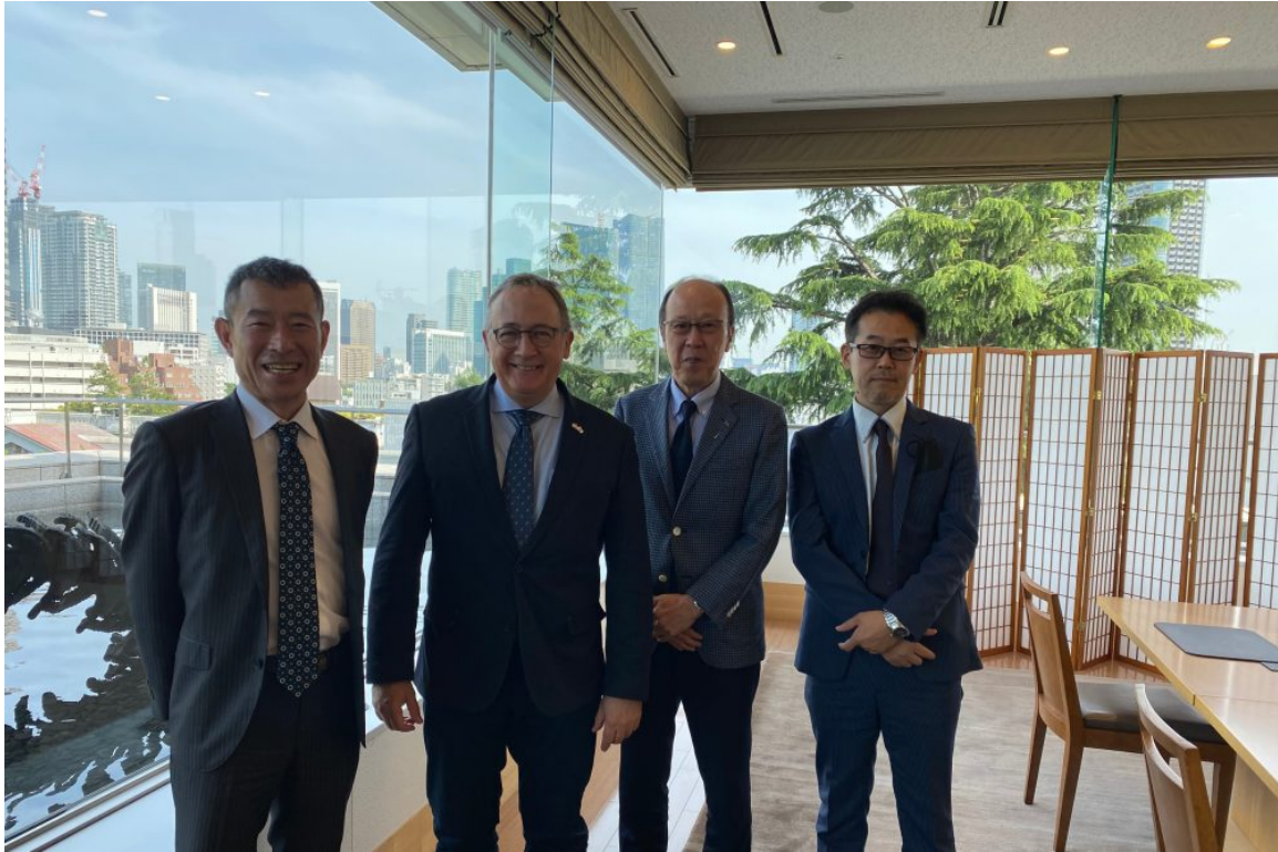
Le député de Berthier-Maskinongé, Yves Perron, lors de son dernier passage en Asie.

Le député de Berthier-Maskinongé, Yves Perron, est de retour du Japon et de Singapour pour faire le point sur une mission riche en rencontres pour son dossier parlementaire. Il accompagnait la ministre fédérale de l'Agriculture et de l'Agroalimentaire, Marie-Claude Bibeau, qui était en rencontre avec ses homologues du G7. Lire l'article>>