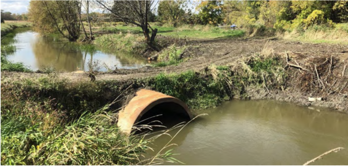
Ponceau non conforme selon un rapport d'inspection