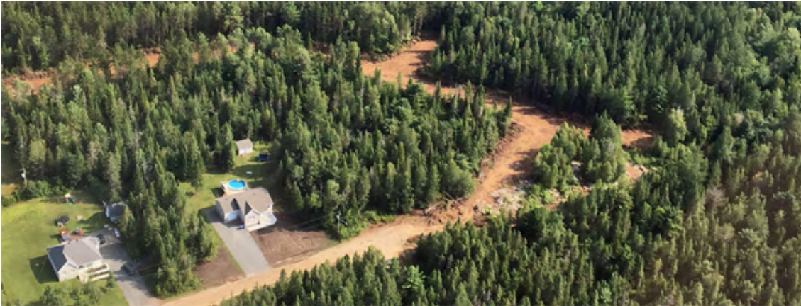
Les Boisés du patrimoine à Saint-Boniface

Le conseil a approuvé le Règlement 524 modifiant les règlements de zonage et de lotissement. Ce règlement vise à intégrer le plan d'aménagement d'ensemble PAE-01-1 – Les Boisés du Patrimoine – Phase III dans les règlements de zonage et de lotissement.