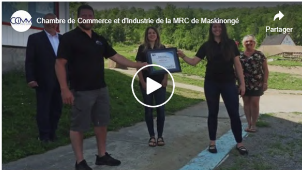
Félicitations à Mont SM pour le prix BON COUP DE L'ANNÉE présenté par MRC de Maskinongé lors de la 33 ième Soirée des Sommets Desjardins Entreprises