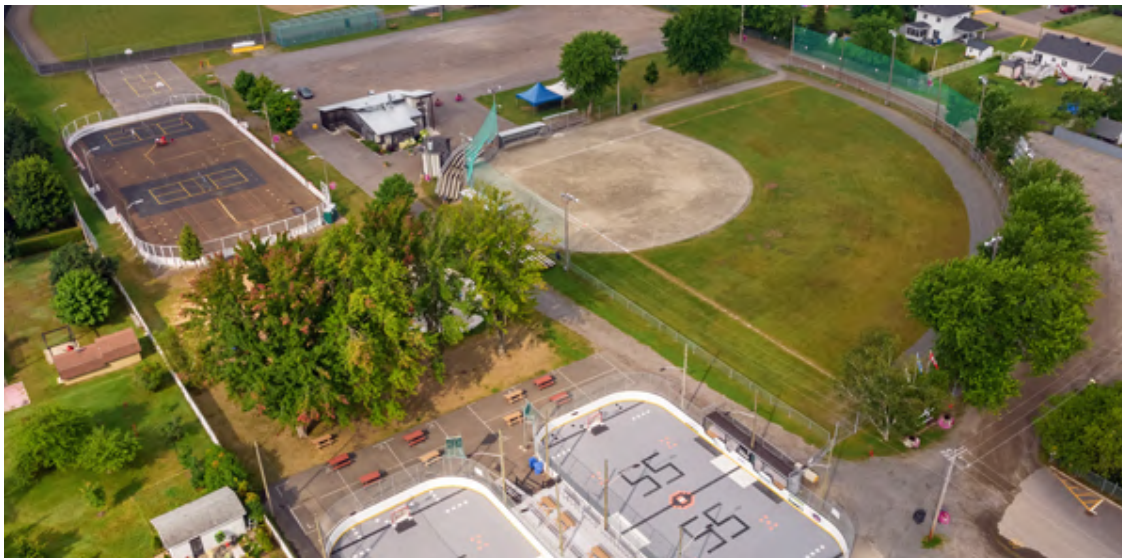
Parc des Grès à Saint-Étienne-des-Grès

Réfection de la patinoire du Parc des Grès Somme allouée de 71 358 $ sur un coût total de 151 330 $