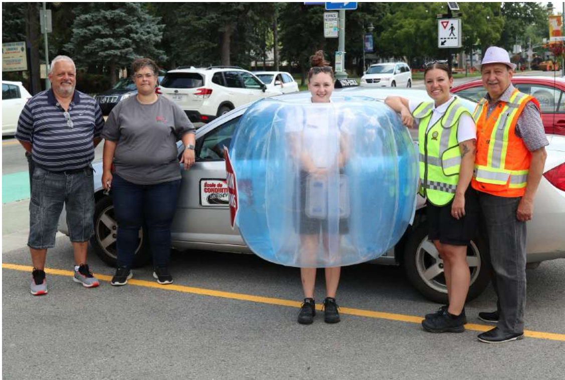
Activité de sensibilisation aux différentes traverses piétonnières du centre-ville de Louiseville en compagnie des cadettes de la Sûreté du Québec et de l'école de conduite de Louiseville.

Chaque jour au Québec, des piétons sont heurtés par un véhicule, principalement en zone urbaine.