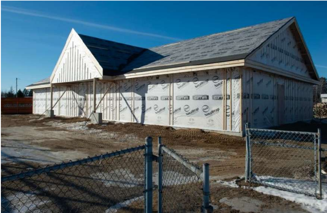
La construction de la bâtisse des loisirs de Charette va bon train.